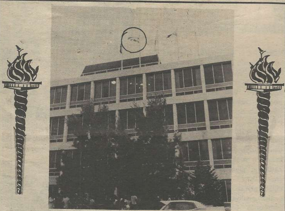
Gradsko Vijećnica grada Fremantle po prvi puta u svojoj povijesti ponosno je bila iskićena hrvatskom zastavom. Kao što slika prikazuje, zastava je stajala na počasnom mjestu, gordo se je vijala, kao da je želila svima doviknuti...još sam tu i nikakova sila na svijetu me ne može uništiti, jer predstavljam simbol, pravde, uspjeha i neugasive slobode!

Riječ o svečanom primanju kod gradonačelnika grada Fremantla. Ovo se je djelomično držalo u tajnosti, jer si zaista nije mogla dozvoliti da netko u zadnji čas pokvari ono na čemu se je sa toliko ljubavi i požrtvovnosti radilo